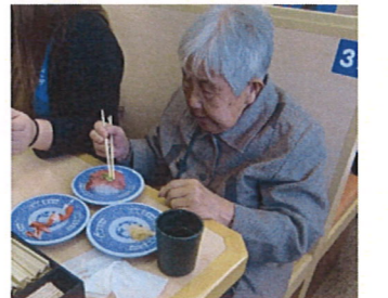
この企画は利用者さんの「もう一度回転寿司が食べたいな」の一言から始まりました。好きなお寿司を食べて楽しい時間が過ごせました。