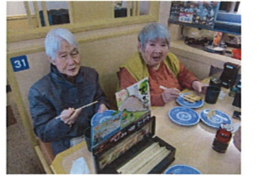
11月第3週にあい愛デイサービスで福知山のくら寿司へ行って来ました。